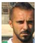
DE TOMMASO 6,35