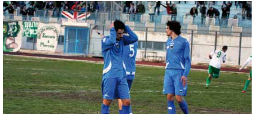
SULLO SFONDO MAJELLA ESULTA PER IL PAREGGIO