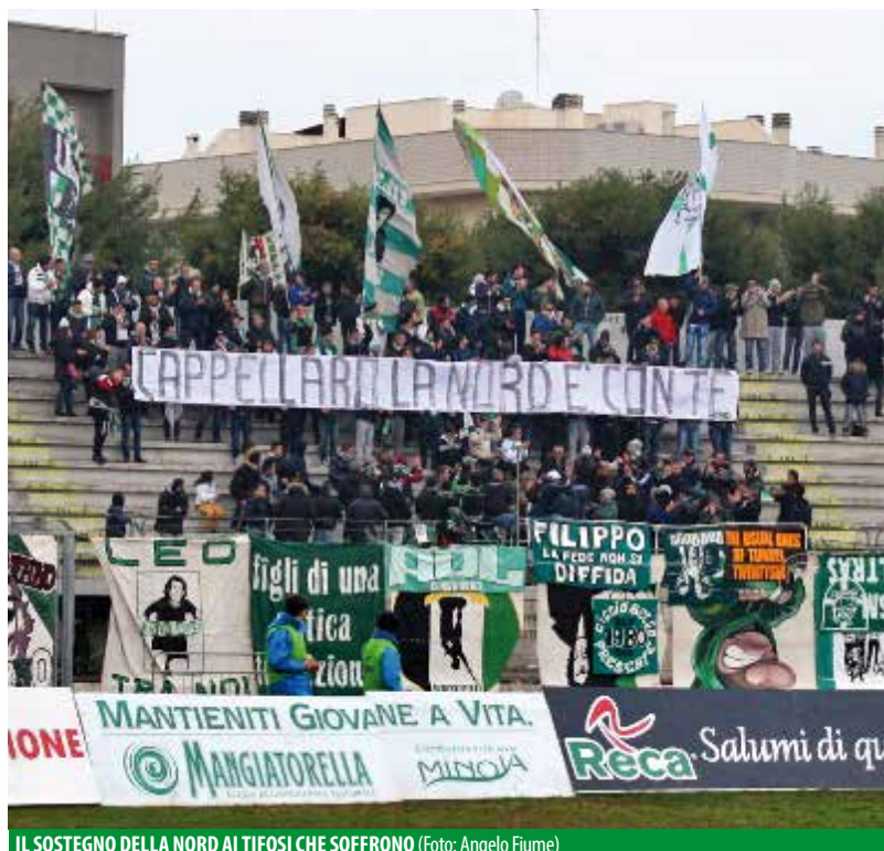
IL SOSTEGNO DELLA NORD AI TIFOSI CHE SOFFRONO