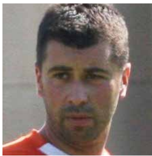
De Luca 5

Dieci minuti e persino inutili, in cui non viene mai servito a dovere.