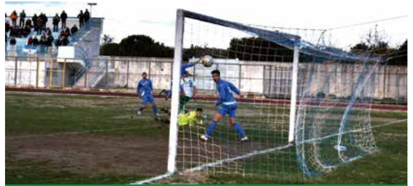
IL PRIMO DEI DUE GOL DI MAJELLA

GROTTAGLIE - MONOPOLI 2 - 2 Rebecca, Presicci (G), doppietta Majella