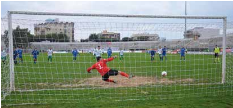
STRAMBELLI TRASFORMA IL RIGORE DEL PAREGGIO